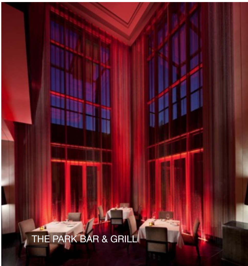
THE PARK BAR & GRILL